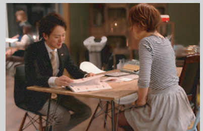
・美容室スタッフに製品説明